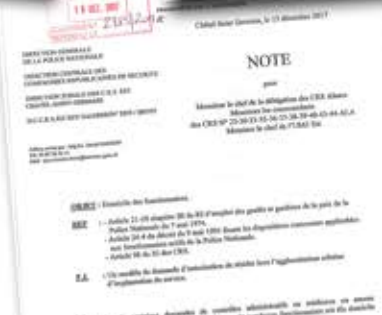
Note du Directeur Zonal en date du 13/12/2017