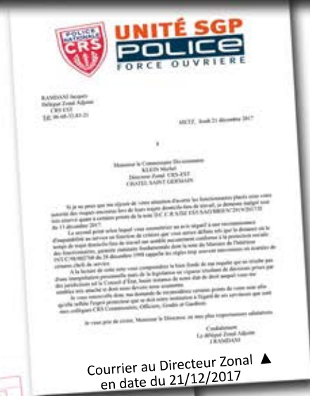
Courrier au Directeur Zonal en date du 21/12/2017