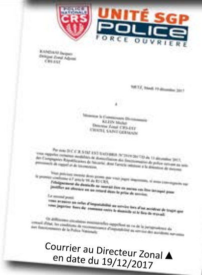
Courrier au Directeur Zonal en date du 19/12/2017